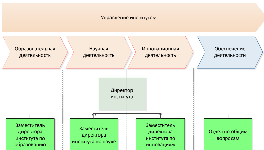
Рис. 2. Основные направления деятельности института