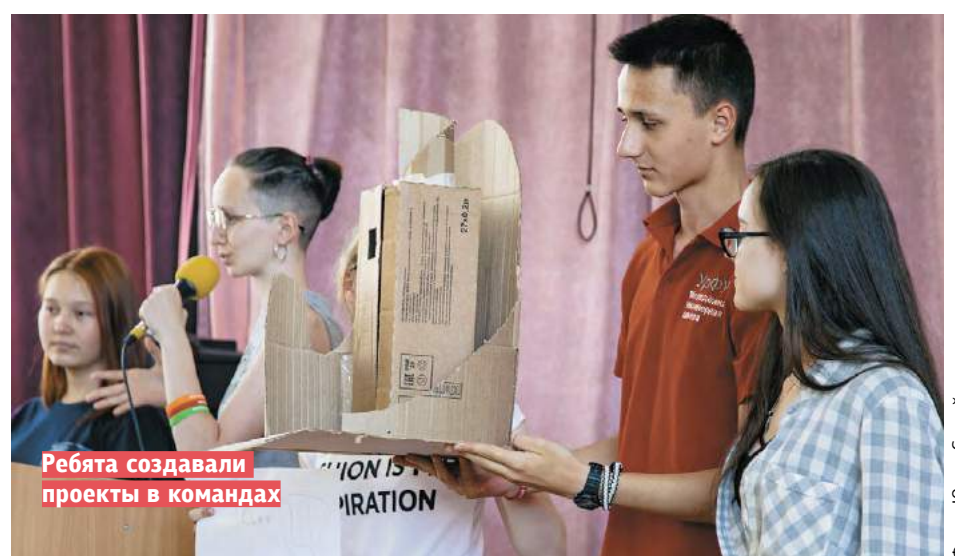
Ребята создавали проекты в командах

— Мы также предлагаем обнести современный стрит-арт малярным скотчем, создавая как бы рамку для уличной галереи. Поскольку авторов никто не знает, мы при-