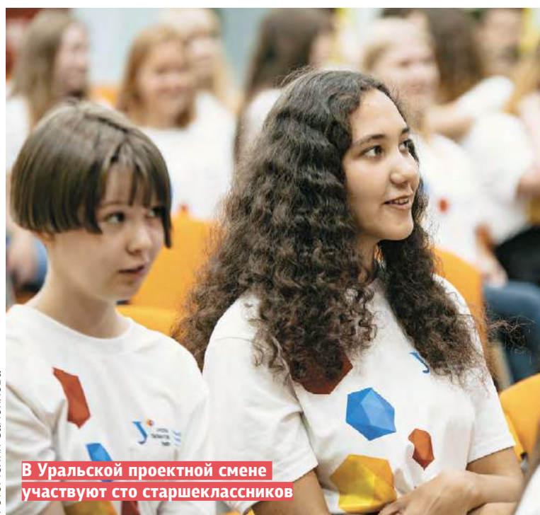
В Уральской проектной смене участвуют сто старшеклассников

— Мы все рассчитываем, что предстоящий юбилей будет хорошим поводом и для подведения итогов, и для того, чтобы посмотреть в будущее — каким будет университет в XXI веке, как он будет развиваться в соответствии с международными стандартами, национальными интересами государства, потребностями науки, промышленности, общества. Здесь достойное место должна занять патриотическая тематика, роль вуза в обороноспособности нашей страны, развитие научно-технического потенциала, воспитания молодого поколения. Важно, чтобы в ходе юбилейных торжеств весомо прозвучало имя первого Президента России. Ельцин-центр как визитная карточка Екатеринбурга тоже будет отмечать столетие УрФУ — через выставки, лекции, семинары, спортивные мероприятия.