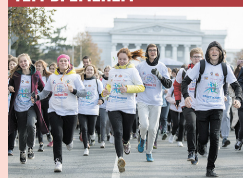
50 тыс. участников пробежали 21 сентября 2023 м на традиционном забеге студентов Екатеринбурга «Кроссе нации». В этом году забег был посвящен Всемирной летней универсиаде — 2023