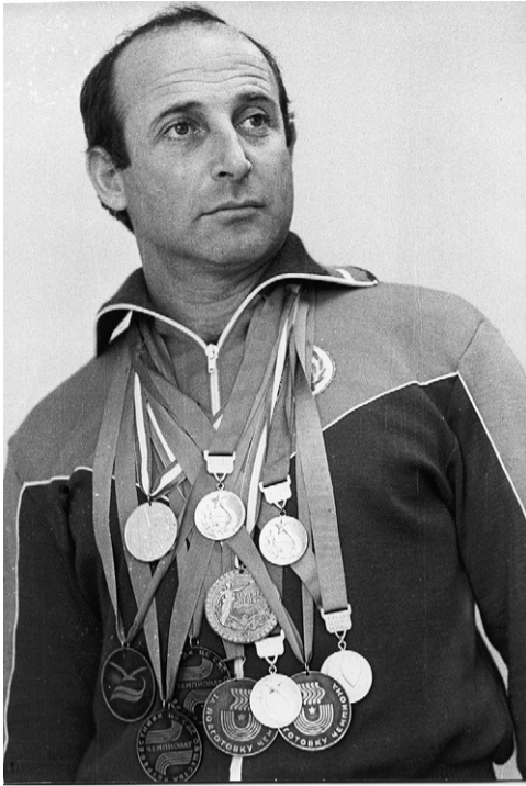
Беседовал Данил Илюхин

— Александр Ефимович, вы ведь по образованию радиотехник. А как объяснить переход на спортивную стезю?