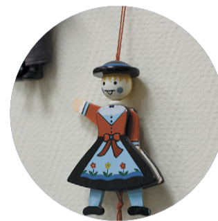
Та самая первая кукла из Австрии