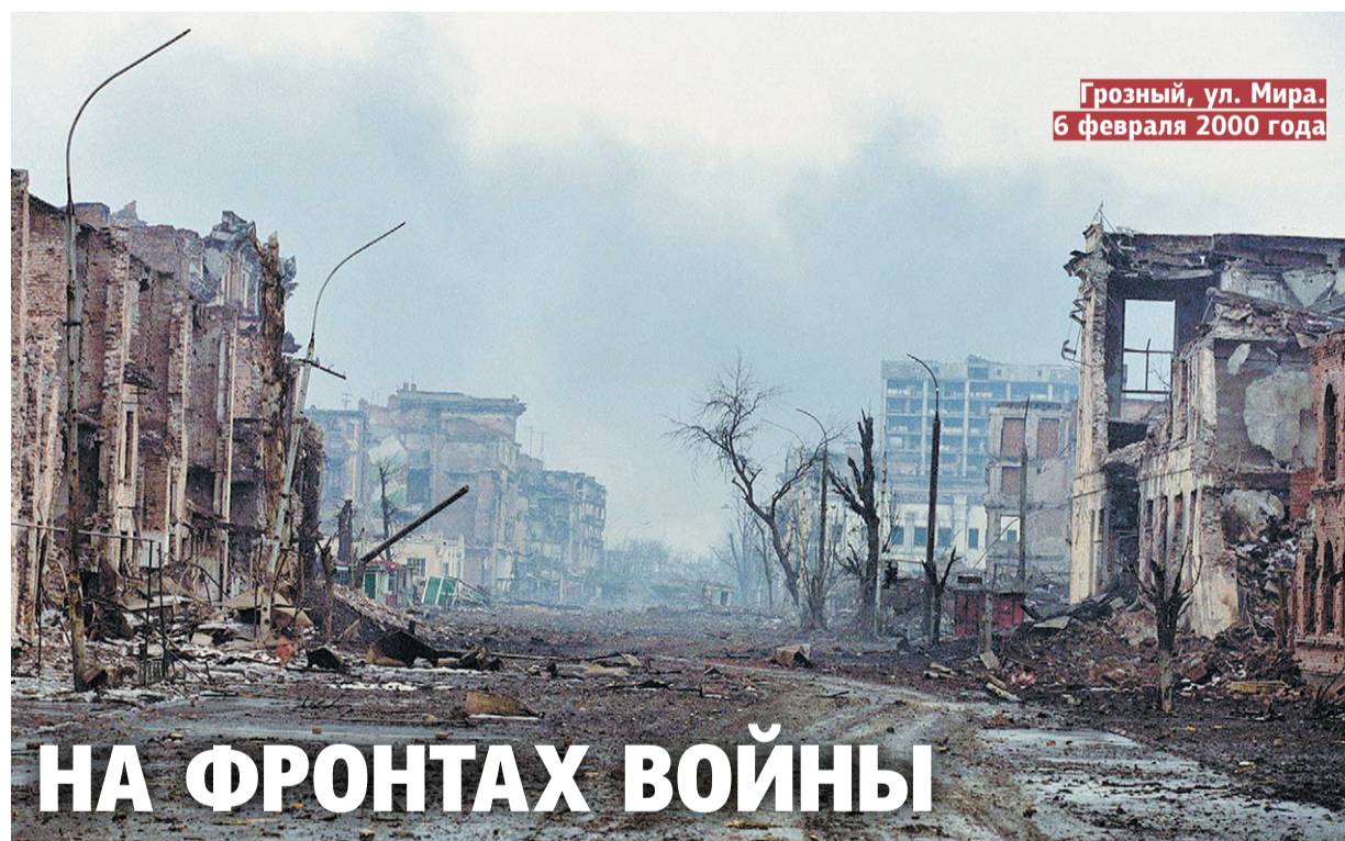
Грозный, ул. Мира. 6 февраля 2000 года

— Что бы вы пожелали нашим студентам? — Студентам я обязательно желаю больших успехов и здоровья. Важно хорошо закончить обучение и удачно начать работать. Будьте хорошими специалистами, ребята. А еще — заботливыми и озорными, как те молодые люди, с которыми я общаюсь.