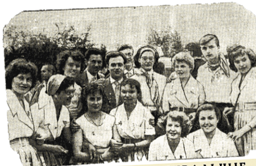
ВСПОМИНАЯ ДНИ ФЕСТИВАЛЬНЫЕ...

Еще одной победой гордится хор Уральского университета. В 1959 году он выступал на Венском фестивале. Открыли концерт песней «Летите, голуби», после недолгого молчания и аплодисментов зазвучали другие: «Буря мглою небо кроет», «Уральскую рябинушку», «Славься» Глинки. И вот золотая медаль у них в кармане, наравне с болгарским, румынским и корейским хорами.