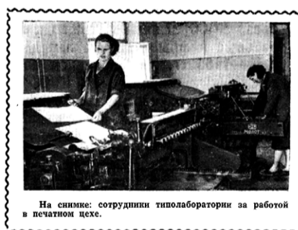
На снимке: сотрудницы типолаборатории за работой в печатном цехе.

22 сентября 1958 года вышел уже пятый спецвыпуск газеты «За индустриальные кадры» на целине. Здесь публикуются новости из совхозов, где уборка урожая вступила в решающую фазу. Одна за другой бригады завершают сдачу хлеба государству. На полосе ярко выделен главный призыв месяца: «Запомни, студент, лозунг простой: «Больше работай, меньше стой!»»