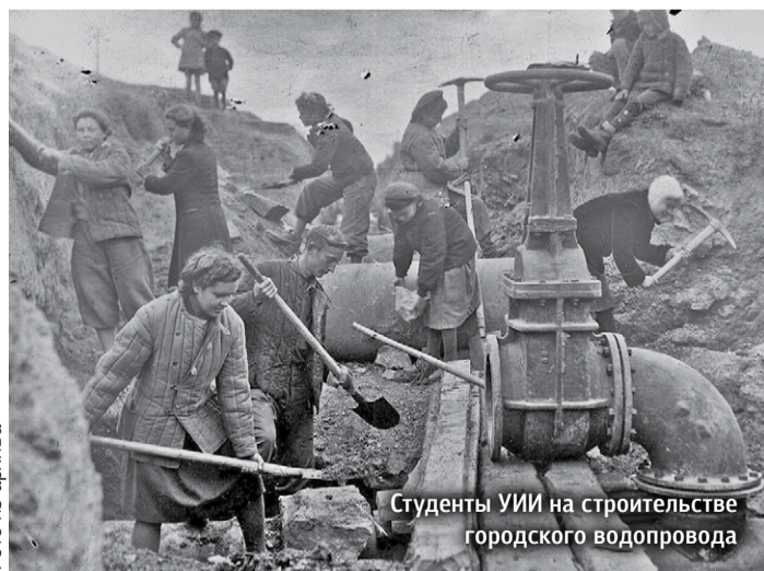
Студенты УИИ на строительстве городского водопровода

В условиях войны подготовка инженеров стала более прагматичной. Производственная практика была подчинена нуждам фронта. Проходила она только на заводах Урала. Студенты определялись на штатные должности мастеров, помощников мастеров, технологов, станочников, становились неотъемлемой частью рабочего коллектива