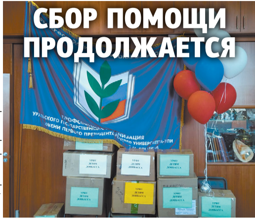
Текст, фото: профком УрФУ

25 апреля профком УрФУ отправил еще одну партию гуманитарной помощи детям Донбасса. Делегаты внеочередной конференции профсоюзной организации УрФУ приняли активное участие в акции «Подарок детям Донбасса». Этим детям нужны забота и поддержка, поэтому были собраны игрушки, книги, одежда, детское питание