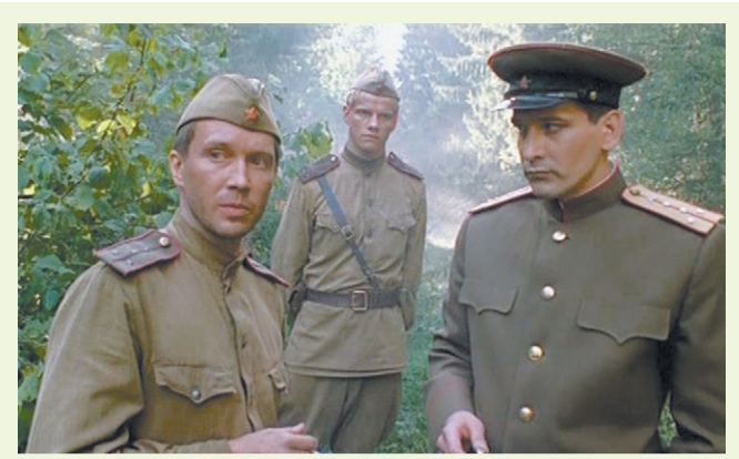
Кадр из фильма «В августе 44-го...»