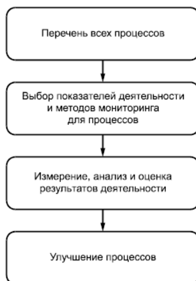
Рисунок 4 - Шаги для использования показателей деятельности

Выбор соответствующих показателей деятельности и методов мониторинга имеет большое значение для результативного измерения и анализа организации. На рисунке 4 представлены шаги для использования показателей деятельности.