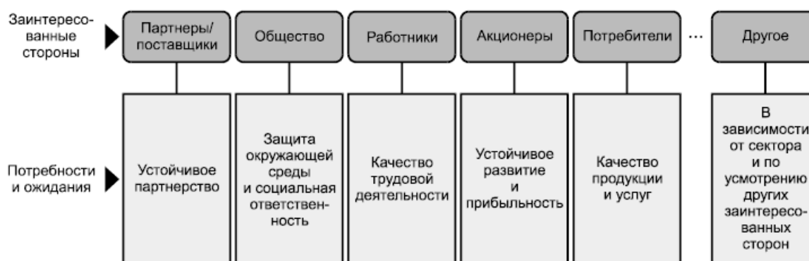
Рисунок 2 - Примеры заинтересованных сторон и их потребностей и ожиданий

Перечень заинтересованных сторон может значительно меняться с течением времени и отличаться в зависимости от организации, отрасли, культуры и страны. На рисунке 2 приведены примеры заинтересованных сторон и их потребностей и ожиданий.